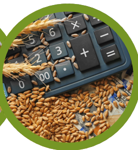
Ekonomika poljoprivrede i prehrambene industrije

Raznovrsni programi omogućavaju studentima da razviju svoj akademski put uz stručnu podršku.